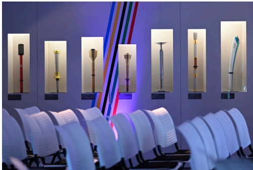
HÅG Conventio Wing schlägt den idealen Bogen vom Thema Sport hin zum bewegten Sitzen.