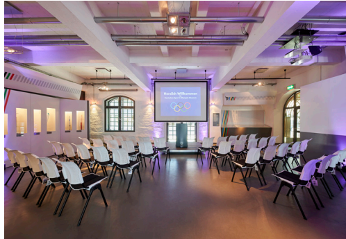
HÅG Conventio Wing verleiht den Eventflächen ein Plus an Agilität.

mit den Verbindungsvorrichtungen, der feste, sichere Stand, seine Stapelbarkeit und eine leichte Reinigung und Pflege machen das Handling für die Veranstalter zudem noch sehr bequem. Der erste Einsatz der neuen HÅG Stühle erfolgte dann bei einem Symposium des Instituts für Biomechanik und Orthopädie der Kölner Sporthochschule. „Passender hätte der Auftakt wohl nicht sein können“, erinnert sich die Geschäftsführerin.