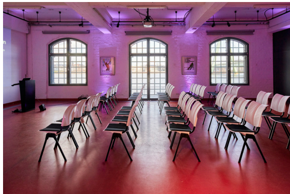
Zur Bestuhlung der Eventflächen entschied sich das Museum bewusst für Modelle von HÄG by Flokk.

Düsseldorf, im Mai 2019 – (fpr) Sternstunden des Sports von der Antike bis heute – im Herzen des Kölner Rheinauhafen begeistert das Deutsche Sport & Olympia Museum mit einer beeindruckenden Sammlung sporthistorischer Originalobjekte sowie faszinierenden Dauer- und Wechselausstellungen. In der denkmalgeschützten ehemaligen Zoll- und Lagerhalle werden geschichtliche Meilensteine, unvergessene Leistungen des Spitzensports und natürlich der olympische Gedanke für die Besucher spür- und erlebbar gemacht. Zusätzlich zum Museumsbetrieb gelten die architektonisch reizvollen Mauern auch als