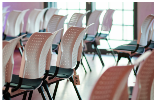
HÅG Conventio Wing überzeugt dank seiner Wippmechanik, die beim Nutzer Aktivität und Bewegung fördert.

Bei der Bestuhlung der Office-Räume sollte es aber nicht bleiben. Bei allen Veranstaltungen – ob private Hochzeit, Konferenz oder Gala – sind die Gäste umgeben vom Thema Sport. „Die Bewegung ist quasi zum Anfassen nah“, so Diaz. „Da bietet es sich doch geradezu an, auch unserem Veranstaltungsangebot ein Plus an Agilität zu verleihen.“ Hierzu ließ sich der gewünschte gesundheitliche Bezug ebenfalls