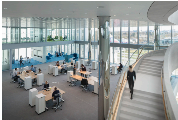
Co-Working, Networking, kreativer Austausch: HÅG Capisco wird den hohen Ansprüchen an innovative Arbeitswelten mehr als gerecht.

Düsseldorf, im April 2019 – (fpr) Immer mehr große und namhafte Unternehmen entscheiden sich dazu, ein hauseigenes Innovation Center ins Leben zu rufen. Interne Mitarbeiter treffen dort in Arbeitsgruppen auf externe Gründer und Start-Ups: Die Global Player auf dem Markt nutzen die kreativen Einflüsse von außen, um Ideen zu entwickeln und zukunftsweisende Innovationen voranzutreiben. Ebenso das Wissenschafts- und Technologieunternehmen Merck, das das internationale Architekturbüro HENN mit dem Bau des Gründerzentrums beauftragte. Das Ziel dabei war, aus dem bisher reinen Produktionsstandort am Hauptsitz in Darmstadt einen Wissenscampus zu kreieren, der zur Visitenkarte des Konzerns wird. Das Bürokonzept enthält temporäre, projektbezogene Arbeitsplätze, die wechselnden Nutzern gerecht werden. Ein wichtiger Bestandteil dabei ist unter anderem die Bestuhlung mit Lösungen von Flokk.