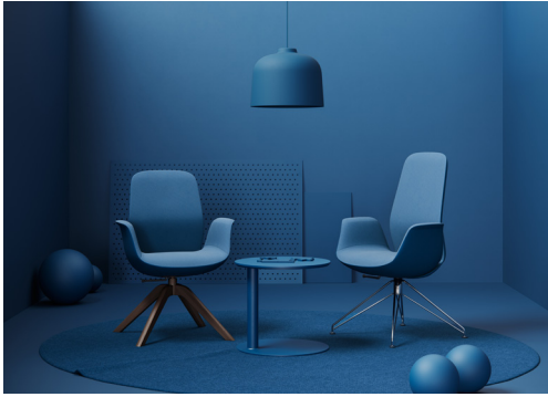
Die Kollektion Ellie Pro vereint ein äußerst komfortables Sitzfeeling mit der Ergonomie und Funktionalität eines Büromöbels.

Stuhl nicht nur einladend und bequem, sämtliche Lehn- und Sitzflächen passen sich dem Nutzer auch ergonomisch ideal an – ein komfortables Sitzgefühl ist garantiert. Armlehnen und Sitzfläche sind übergangslos miteinander verbunden und erzeugen ein tulpenähnliches Äußeres, an das sich die Form des beweglichen Stuhlrückens harmonisch anschließt. Dieses stromlinienförmige Design erlaubt zum einen die unsichtbare Einarbeitung aller technischen Details. Zum anderen lässt sich das Möbel so vollständig in Stoff hüllen, inklusive des Gehäuses und aller beweglichen Teile. Dadurch entstand eine Lösung im wohnlich-gemütlichen Look, die dank ihrer intuitiven, höhenverstellbaren Mechanik zudem allen Ansprüchen an einen individuell anpassbaren Arbeitsstuhl gerecht wird.