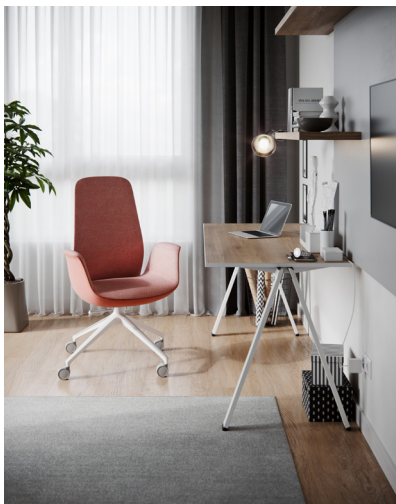
Ellie Pro schließt die Lücke zwischen der Funktionalität eines Bürostuhls und dem Komfort eines Sessels – ideal auch für das Home-Office.

Mit Ellie Pro bringt der polnische Marktführer Profim, eine Marke von Flokk, eine Stuhlkollektion auf den Markt, die die Annehmlichkeiten eines Polstersessels mit der funktionalen Ergonomie eines Bürostuhls elegant zu verbinden weiß – beste Voraussetzung für die Gestaltung moderner, wohnlich wirkender Arbeitsumfelder.