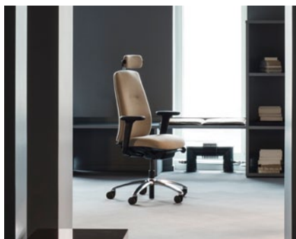
Dank der innovativen 2PP™-Mechanik des RH New Logic erhält der Nutzer Entlastung und Unterstützung zugleich.

für längere Telefonate. Darüber hinaus entlastet die luftregulierte Lordosenstütze den unteren Rücken zusätzlich. Auch das Sitzpolster ist so gestaltet, dass die nach vorne abgeschrägte Sitzkante als auch die passgenau verstellbare Sitztiefe den Druck auf die Oberschenkel minimieren. Das Ergebnis ist eine verbesserte Blutzirkulation der Beine. Das innovative Herzstück des RH New Logic ist die 2PP™-Sitzmechanik: Dank dieser korrespondieren die primären Neigungsachsen des Stuhls, die sogenannten Pivot Points, mit den maßgeblichen Bewegungsachsen des Körpers – dem Knie- und Hüftgelenk. Zum