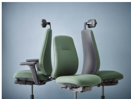
Die Ausstattung des RH New Logic lässt sich individuell zusammenstellen. Nutzer erhalten ihr maßgeschneidertes Modell.