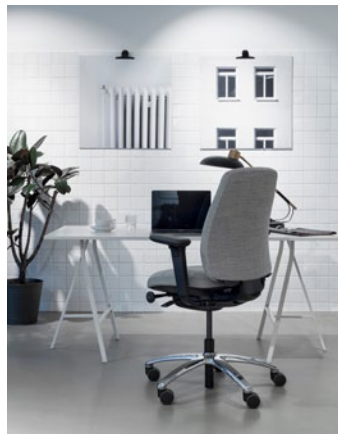
RH New Logic: maximaler Sitzkomfort für ein fokussiertes, produktives Arbeiten.

Form follows function – der RH New Logic ist die Versinnbildlichung dieses Leitbilds. Seine visuelle Gestaltung spiegelt dessen Funktion perfekt wider. So sorgt die gewölbte, taillierte Rückenlehne nicht nur dafür, den Rücken aufrecht zu halten, die Polsterung im oberen Bereich der Rückenlehne – das sogenannte Tvedt-Kissen – drückt die Schulterblätter sanft nach hinten und der Brustkorb öffnet sich automatisch. Ein freies, tiefes Atmen und eine bessere Versorgung mit Sauerstoff sind die Folge. Der Winkel der Rückenlehne sowie der Neigungswiderstand können stufenlos auf die individuellen Vorlieben und Tätigkeiten angepasst werden, ob vorgebeugt für Bildschirmarbeit oder zurückgelehnt