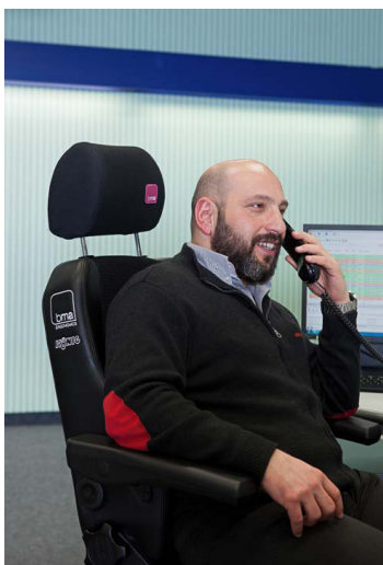
Individuell einstellbar und ideal für den Dauereinsatz: der BMA Secur 24 Basic.

In drei Schichten sind die Plätze der Leitstelle in der Dortmunder Innenstadt besetzt. Als hier neue Stühle benötigt wurden, die einem 24-Stunden-Betrieb auf Dauer standhalten,