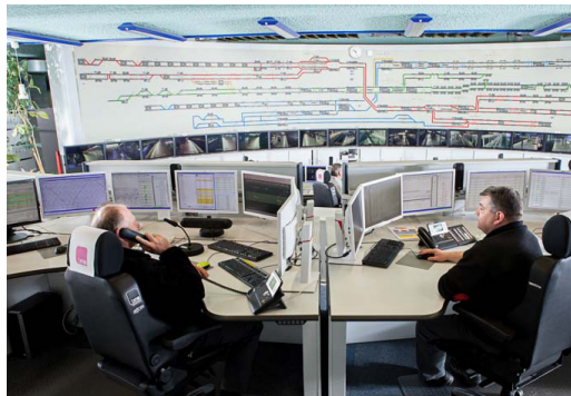
In der Leitstelle DSW21 laufen die Verkehrsadern der Stadt Dortmund zusammen, der 24/7-Stuhl BMA Secur 24 Basic unterstützt die Mitarbeiter bei ihrer verantwortungsvollen Aufgabe.

Düsseldorf, im Mai 2018 – (fpr) In der Leitstelle der Dortmunder Verkehrsbetriebe DSW21 spürt man den Puls der Stadt. Hier laufen alle Fäden zusammen und die Mitarbeiter haben 24 Stunden am Tag, sieben Tage die Woche ein wachsames Auge auf die Mobilität in der Metropole. Das Team sorgt für einen reibungslosen Ablauf, denn alle Verbindungen mit Bussen und Bahnen werden von der Leitstelle aus koordiniert, gesteuert und überwacht.