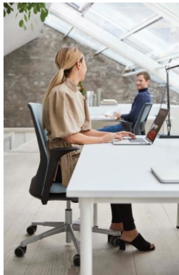
Intuitive Bedienelemente und eine hohe Benutzerfreundlichkeit zeichnen HÅG Futu mesh aus.

Düsseldorf, im April 2018 (fpr) – Die heutige Arbeitswelt ist agiler als je zuvor. Konventionelle Unternehmensstrukturen brechen auf, fixe Arbeitsplätze weichen Co-Working-Zonen und die Zusammenarbeit wird durch wechselnde Teams und Projekte bestimmt. Mit dem Wandel verändern sich aber auch die Anforderungen an die jeweilige Arbeitsplatzumgebung, denn diese muss die (Weiter-)Entwicklung nicht nur zulassen, sondern flexibel mittragen. Um hier die Produktivität erhalten sowie optimieren zu können und dadurch wettbewerbsfähig zu bleiben, ist Anpassungsfähigkeit der Schlüssel zum Erfolg. Hier kommt HÅG Futu mesh ins Spiel. Das jüngste Mitglied der HÅG-Familie ist eine leistungsstarke Sitzlösung. Dank intuitiver Bedienelemente lässt er sich schnell, einfach und unkompliziert auf die individuellen Bedürfnisse wechselnder Nutzer einstellen und eignet sich aufgrund seiner hohen Benutzerfreundlichkeit perfekt für dynamische Arbeitsumgebungen.