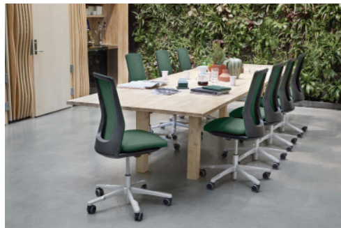
HÅG Futu mesh unterstützt, auch in langen Meetings länger wach, konzentriert und leistungsfähig zu bleiben. kombinieren lassen.

Langes Verharren in einer starren Sitzposition wirkt sich negativ auf Rückengesundheit und Muskulatur aus und kann die Leistungsfähigkeit von Mitarbeitern negativ beeinflussen – daher ist es seit jeher das Anliegen von HÅG, mehr Bewegung in den Arbeitsalltag zu bringen. Bei der HÅG Futu Kollektion liegt der Schlüssel zum Erfolg im Inneren des Stuhlkorpus – nicht sichtbar, aber jederzeit spürbar. Die fußgesteuerte HÅG in Balance® Mechanik hält den Nutzer nicht nur stetig im Gleichgewicht, sondern fördert zudem die Blutzirkulation der Beine und hilft so, auch an kräftezehrenden Arbeitstagen länger wach, konzentriert und leistungsfähig zu bleiben. „Die Mechanik folgt jeder Bewegung des Nutzers und hält ihn stets im Gleichgewicht. Dies motiviert, dem natürlichen Bewegungsdrang nachzugeben und die Sitzposition häufiger zu wechseln – ganz intuitiv“, fasst Sitter zusammen. „Ganz nebenbei wird diese erhöhte Aktivität zum festen Bestandteil des Sitzverhaltens und wird zur Routine.“