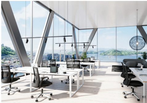
HÅG Futu mesh ist die perfekte Sitzlösung für moderne Bürolandschaften.

und unkompliziert – ideal zugeschnitten auf den Einsatz in Büros mit wechselnden Nutzern. „HÅG Futu mesh hat dank seiner hohen Benutzerfreundlichkeit stets die individuelle ‚Komfortzone‘ im Blick, denn er passt sich perfekt den unterschiedlichen Bedürfnissen der Nutzer an“, so René Sitter. „Dadurch bietet er ein komfortables Sitzerlebnis, gibt dem Mitarbeiter bestmögliche Unterstützung und fördert