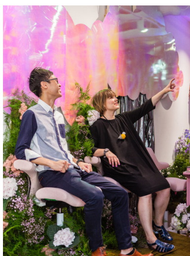
Auf dem HÅG Capisco lässt sich einfach mal die Perspektive ändern.

Die historischen englischen Gärten von Clerkenwell dienten dem renommierten Designbüro als Inspirationsquelle. Das Team aus Architekten, Innenarchitekten und Stadtplanern erschuf für HÅG den Lustgarten „Sensorium“. Dieser künstliche Garten erstreckte sich über die gesamte Räumlichkeit und lud die Besucher dazu ein, die Welt in einem neuen Licht, aus anderen Blickwinkeln und mit allen Sinnen zu betrachten. Die aufwendige Verwandlung mit hunderten Pflanzen und kleinen Skulpturen wurde noch durch verschiedene Gerüche, Texturen und Klänge unterstützt. Unter Einbeziehung des HÅG Capisco zeigte „Sensorium“ den Besuchern vor allem neue Perspektiven auf. Den Designern bei HASSELL