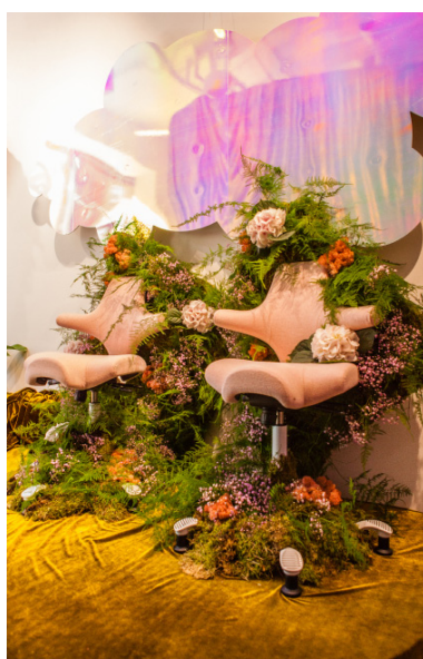
Ikonisches Design trifft auf temporäre Kunst: HÅG Capisco.

Düsseldorf, Juli 2016 – (fpr) Alles, was in Sachen Design Rang und Namen hat, trifft sich jährlich auf der Clerkenwell Design Week in London. In dem kreativen Viertel Clerkenwell sind zahlreiche Showrooms, Architekten und Designer ansässig. Im Rahmen des Designfestivals finden hier neben Ausstellungen auch Workshops und Vorträge statt. Aber vor allem ist Platz für ungewöhnliche Begegnungen und kreative Kooperationen. Was passiert, wenn skandinavisches Stuhl-Design auf britischen Ideenreichtum trifft, konnte man in diesem Jahr mit allen Sinnen selbst erleben. Durch die Kunst-Installation „Sensorium“ verwandelte das Designbüro HASSELL den Londoner HÅG Showroom in einen urbanen Lustgarten, der die Besucher zu einem sinnlichen Spaziergang einlud.