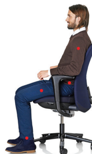
An verschiedenen Körperstellen der Testpersonen wurden Sensoren angebracht, um erfassen zu können, wo und wann am meisten Bewegung erzeugt wird.

Die Ausgangsfrage für die Studie war folgende: Kann der Stuhl, auf dem man täglich viele Stunden sitzt, das Aktivitätsniveau erhöhen? Um erfassen zu können, wann und wo Bewegung am meisten gefördert wird, wurden 15 gesunde Testpersonen, die Erfahrung mit Computerarbeit aufweisen, an verschiedenen Stellen des Körpers mit Bewegungssensoren ausgestattet. Sie simulierten die Arbeit am Computer auf HÅG SoFi mit zentraler Neigungsmechanik, jeweils in bewegtem und in arretiertem Zustand. Im Vergleich dazu: ein herkömmlicher dynamischer Bürostuhl mit Synchronmechanik und die Arbeit im Stehen. Dabei wurden sie bei zufällig ausgewählten dynamischen und statischen