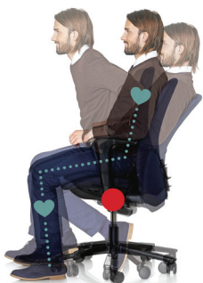
Die zentrale Neigungsmechanik bei HÅG SoFi fördert die Vor- und Rückwärtsbewegung beim Sitzen besonders stark.

Tätigkeiten beobachtet wie beispielsweise dem Abtippen langer Texte am Computer – und das im Hinblick auf die Aktivität, die Sitzhaltung, den Sitzkomfort und die Arbeitsleistung des Nutzers.