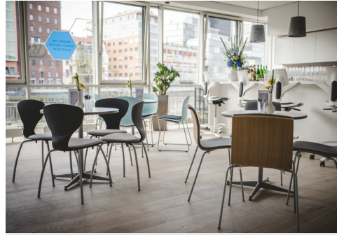
Im Bistrobereich lädt die neue HÅG Capisco Puls White Edition an der Bar und die farbenfrohen Kantine Stühle der Marke RBM zum Verweilen ein.