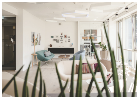
Hell, freundlich und lichtdurchflutet setzt der Showroom die Sitzmöbel perfekt in Szene.

Düsseldorf, im Juli 2015. Nach dem erfolgreichen Showroom-Opening von Scandinavian Business Seating im Juni kann das gesamte Spektrum der drei Marken HÅG, RH und RBM nun entdeckt und getestet werden: Der neue Showroom in der attraktiven Umgebung des Düsseldorfer Medienhafens steht allen Besuchern zu den Geschäftszeiten des Unternehmens offen. Auch sind die Räumlichkeiten im modernen und frischen skandinavischen Ambiente für Meetings nutzbar.