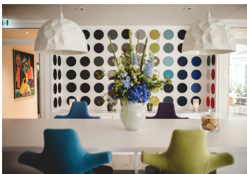
Kreative Raumgestaltung: Die kreisförmige Stoffmusterpalette spiegelt zum einen das Standardsortiment wider und zum anderen schafft sie eine fröhlich bunte Atmosphäre.

Neben den trendigen Sitzmöbeln, präsentiert in verschiedenen Themenwelten, begegnet man im lichtdurchfluteten Showroom immer wieder tollen Highlights, wie zum Beispiel der kreisförmig gestalteten Farbpalette oder der künstlerischen Installation von Rückenlehnen des Designklassikers HÅG Capisco. Der Showroom überrascht mit vielen kreativen Ideen und Anregungen in erfrischendem Design und inspiriert dazu, eine innovative und lebendige Büroatmosphäre zu schaffen.